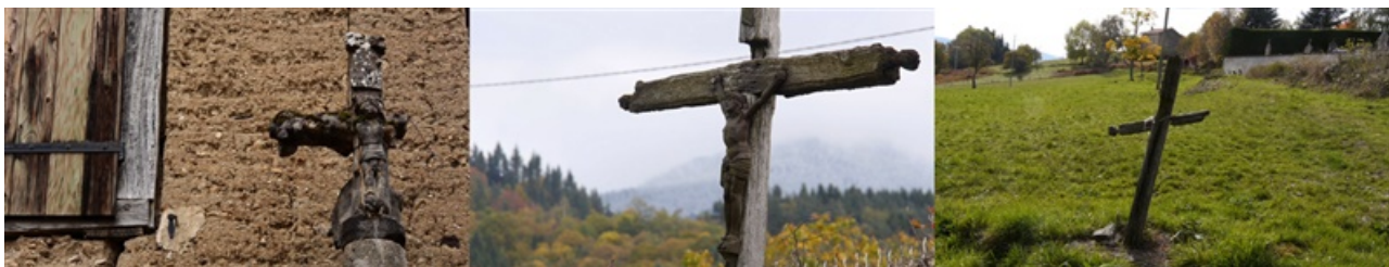
Road Movie , création en résidence de Peter Bogers

Arrêter sa voiture de manière aléatoire près d'une statue, puis éteindre le moteur, peut faire ressentir un renversement impressionnant de l'état d'esprit. L'arrêt et le silence naturel provoquent un changement radical. La statue elle-même aide cette transition soudaine vers une méditation contemplative